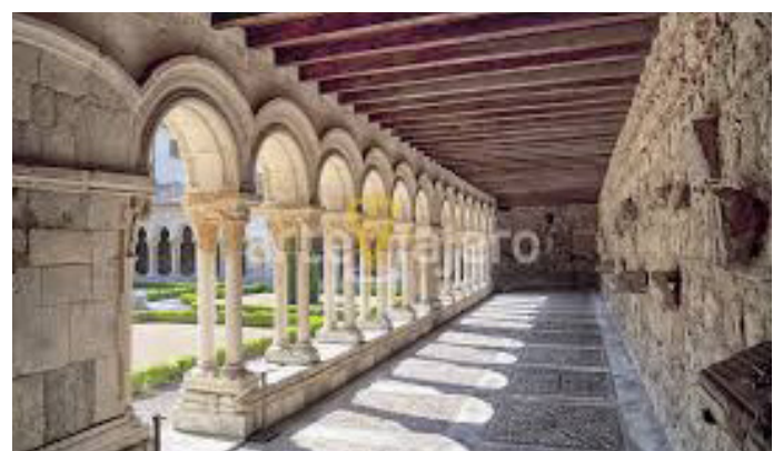
cloitre couvent de las Huelgas