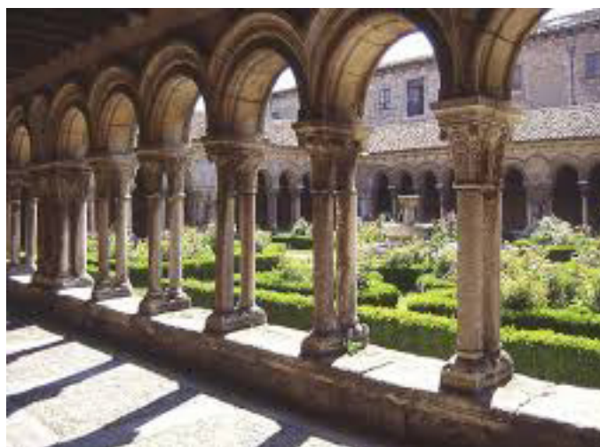
cloitre du Monastere de las Hulegas