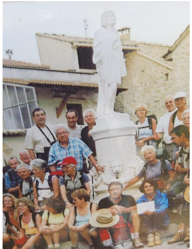
Patrice. Statut de saint Pons. Rangée du haut, milieu.