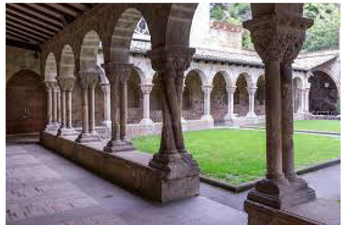
Cloître de San Pedro de la Rua

de la Rua au porche polylobé, avant de poursuivre jusqu'à un autre chef d'œuvre de l'art roman qu'est l'église San Miguel, sans oublier au bord de la rivière Ega le beau portail gothique de l'église du San Sepulcro... Et cette énumération n'est qu'un avant-goût des splendeurs dont regorge cette petite ville de seulement 15 000 habitants telle une capitale !