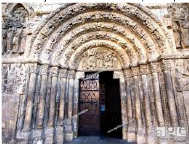
Portail de l'église romane de San Pedro

étroites qui semblent, comme un entonnoir, vouloir nous happer, notre fatigue s'évanouit pour laisser place à l'émerveillement devant la magnificence d'une ville au charme irrésistible. Estalla-la-Bella, tout un symbole sur le chemin des étoiles mérite bien son nom pour la profusion des monuments qui la compose sur les hauteurs de part et d'autre de la plaza mayor. Le temps d'un rafraîchissement dans l'ambiance conviviale du cœur palpitant de la ville dont seuls les Espagnols ont le secret, et nous partons à la découverte de ces merveilles architecturales