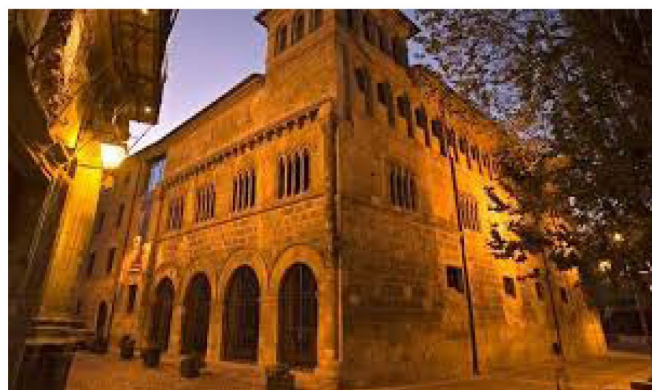
Palais des Rois de Navarre

: le palais des Rois de Navarre (rare exemple de l'art roman civil), puis nous grimpons les marches vers l'église romane San Pedro