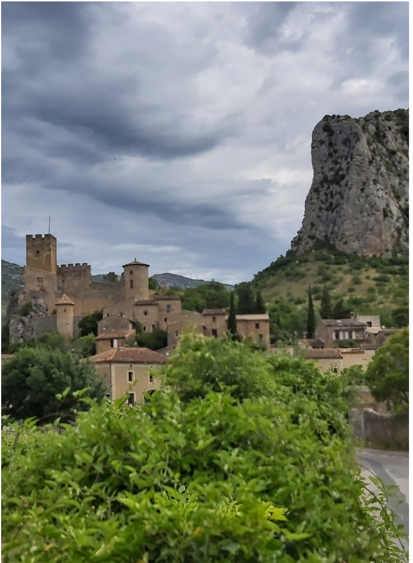
St-Jean de Bueges, village.