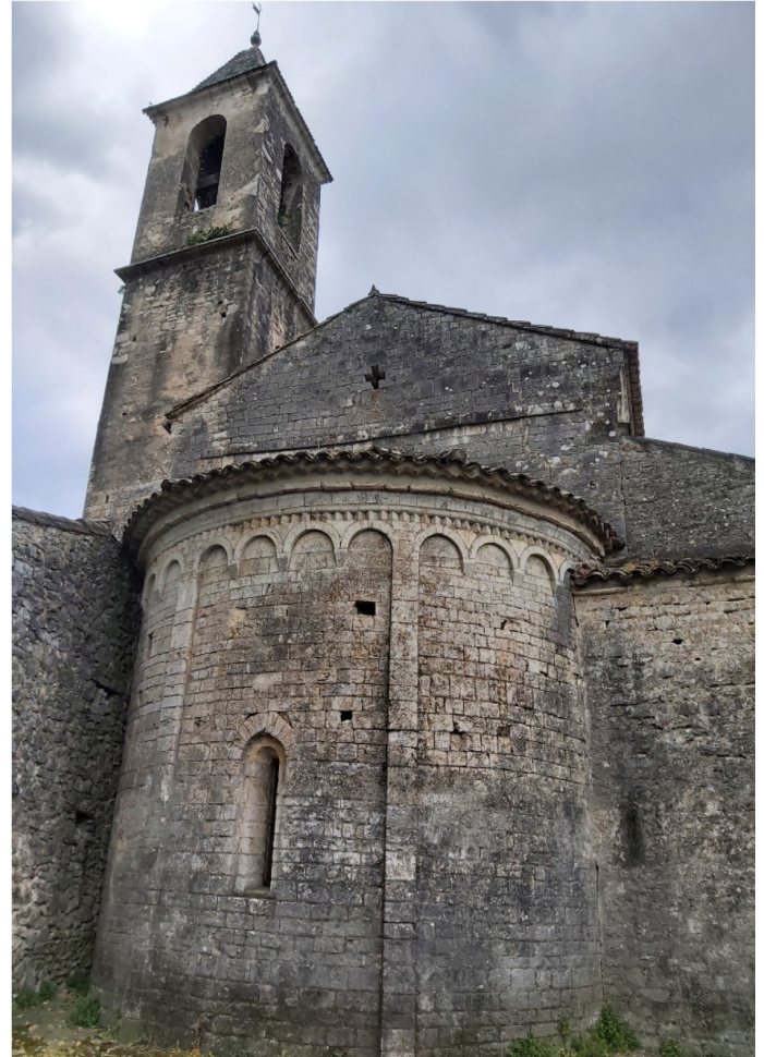
St-Nazaire de Brissac