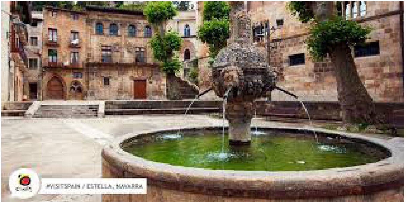
Fontaine dans un écrivain de maison de charme

de la Rua au porche polylobé, avant de poursuivre jusqu'à un autre chef d'œuvre de l'art roman qu'est l'église San Miguel, sans oublier au bord de la rivière Ega le beau portail gothique de l'église du San Sepulcro... Et cette énumération n'est qu'un avant-goût des splendeurs dont regorge cette petite ville de seulement 15 000 habitants telle une capitale !