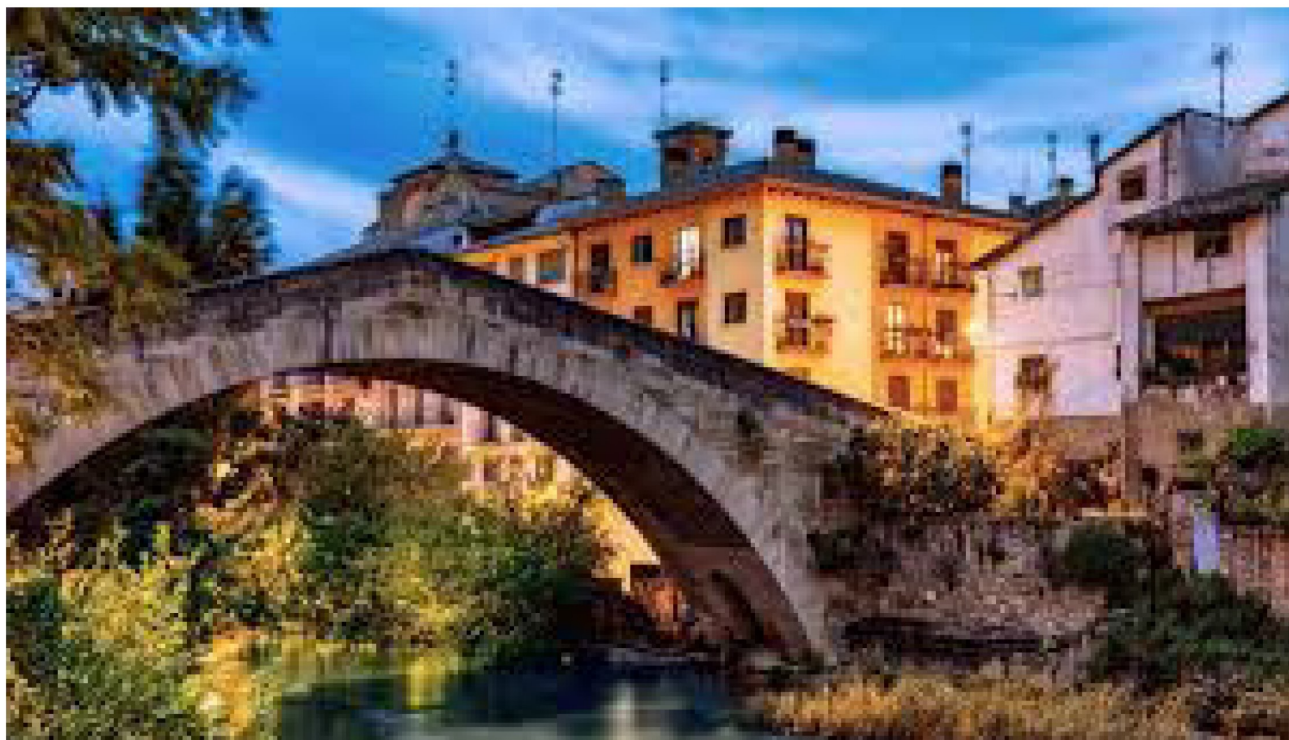
Ville et pont à dos d'âne sur le rivière Ega