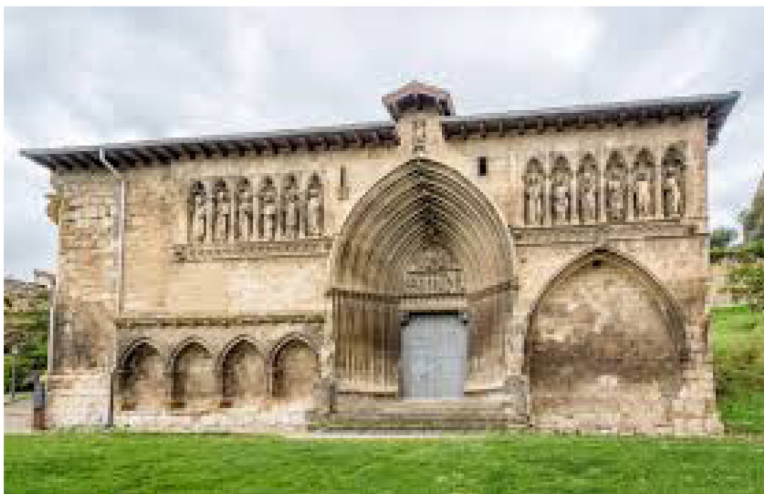
Eglise du San Sepulcro