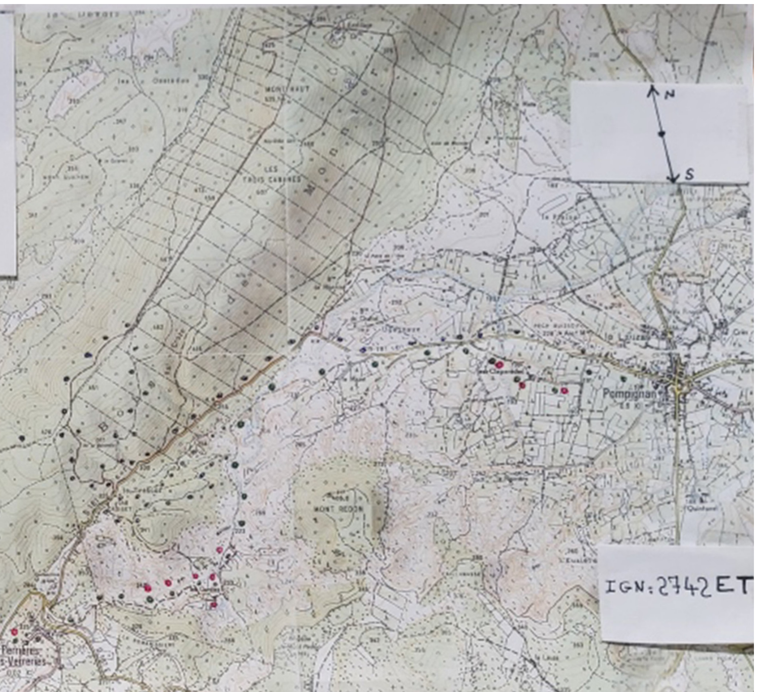
Carte du tronçon Pompignan-St-Bauzille