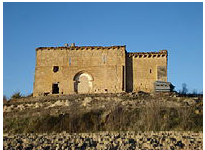
ermita san martin

de la ville fortifiée créée au XIII e siècle par Sancho le Fort. C'est bien la position géographique stratégique aux confins des deux provinces qui a donné à Viana au fil des siècles de compter un patrimoine architectural civil et religieux aussi riche que diversifié. Face à