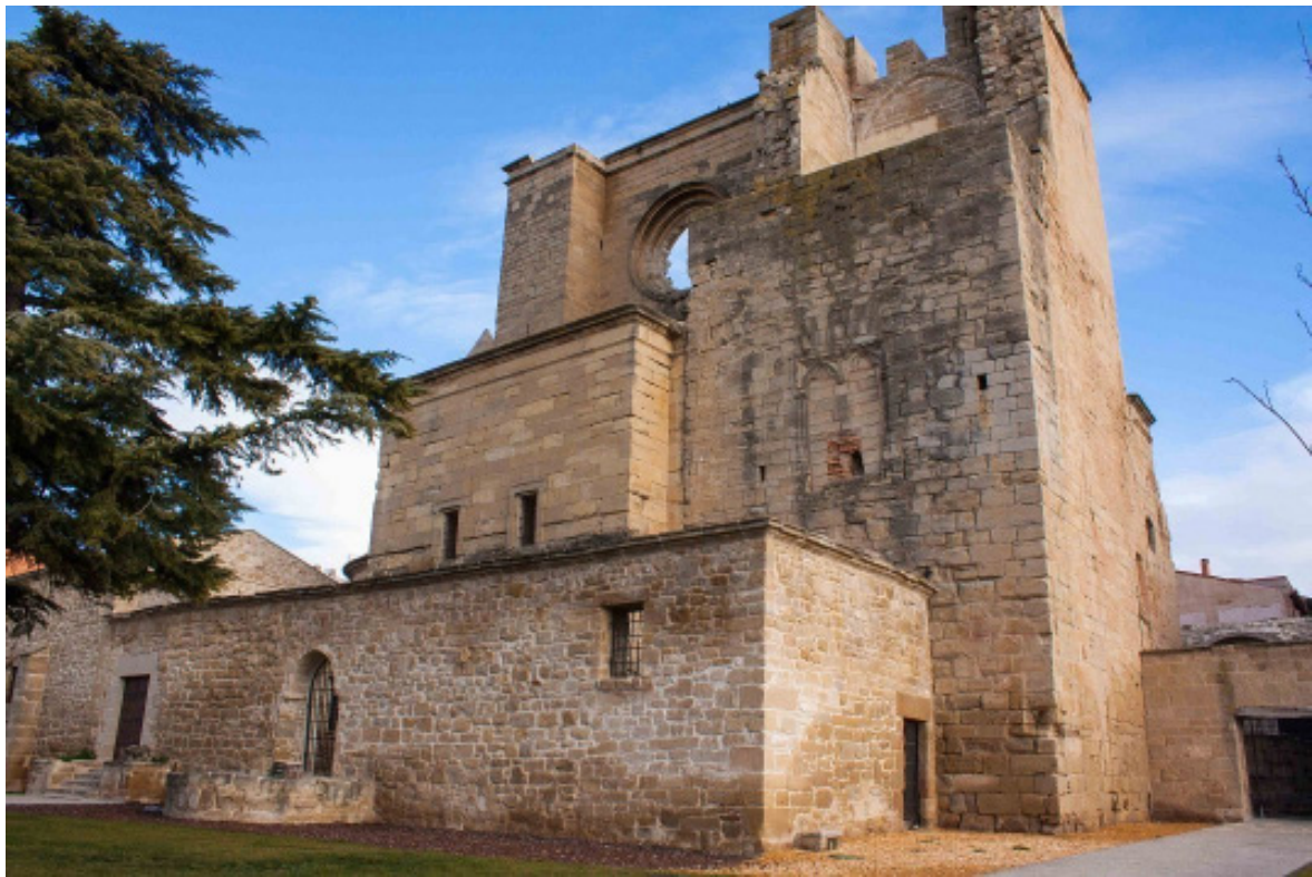
eglise San pedro Viana

l'église, sur l'autre côté de la plaza Major, l'hôtel de ville du XVII e avec ses deux tours, est un bel exemple d'architecture civile tandis que les hôtels de style Renaissance ou Baroque sont nombreux à travers ses rues tracées au cordeau qui rappellent le plan d'une bastide française. L'ancien hospice des pèlerins Notre-Dame de Grâce devenu le centre culturel dans la rue Navarro Villoslada qui marque l'ancien chemin de Compostelle des XIII e et XIV e siècles. Mais ce qui nous a le plus impressionné, c'est l'ardeur développée par la municipalité et la population pour restaurer les ruines de l'église gothique San Pedro plus ancienne de deux cents ans que l'église paroissiale. L'édifice qui fut victime d'un effondrement en 1844 était, à l'époque, soutenu par des étais et des palissades. Mais les restaurations se sont poursuivies au fil des décennies pour se terminer en 2010 : l'espace désormais sécurisé met en exergue la belle façade de San Pedro avec sur l'arrière du bâtiment, un parc (qui n'est autre que l'ancien cimetière), depuis lequel on peut découvrir un superbe panorama sur la vallée de l'Ebre.