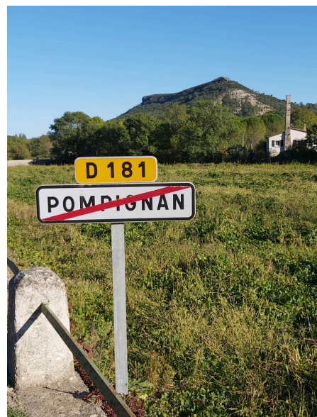
Étape Pompignan-St-Bauzille, départ.

Nous avons donc réussi à trouver un itinéraire Pompignan-St-Bauzille qui nous fait emprunter uniquement des chemins anciens. Il nous reste encore 30 km jusqu'à St-Guilhem et nous passerons probablement par Les Causse de La Selle.