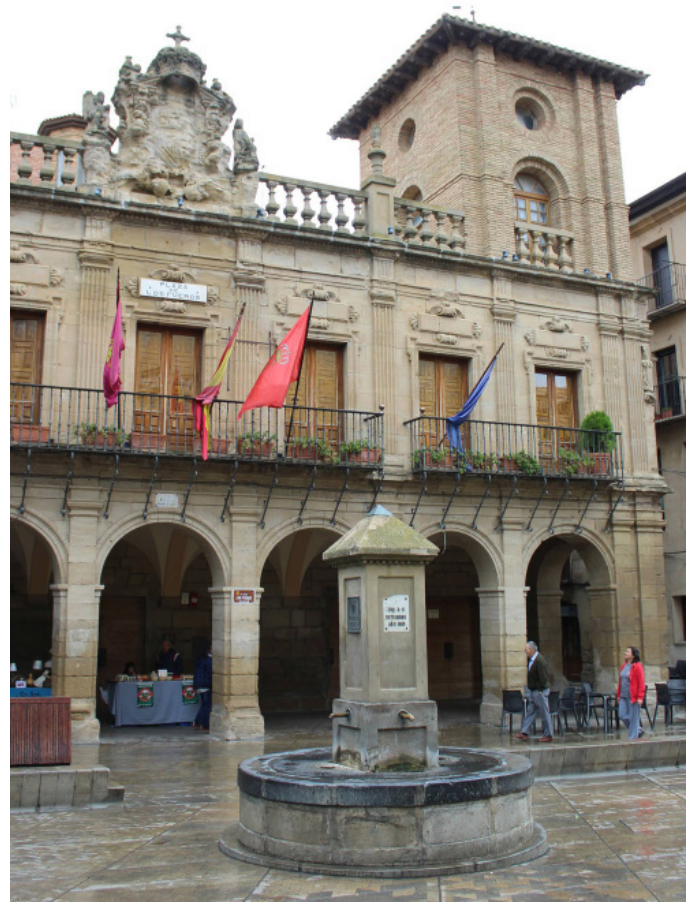
hotel de ville Viana

La petite ville de Viana entre Los Arcos et Logrono peuplée aujourd'hui de 4 000 habitants est la dernière bourgade de la grande Navarre sur le Camino avant la petite province de la Rioja. Chose curieuse, on y parle cependant le castillan, le basque n'est pas la langue officielle. A notre arrivée à la fin d'un après-midi brûlant d'août de 1994, nous nous sommes réfugiés dans la relative fraîcheur de son église Santa-Maria (XV et XVI e siècles) aux dimensions impressionnantes par rapport à la taille de la ville. Son chœur présente une haute façade baroque toute pimpante d'or qui capte le regard. De retour au soleil déclinant, nous sommes rapidement happés par l'ambiance médiévale qui émane des rues pavées, de ses portes, ultimes vestiges