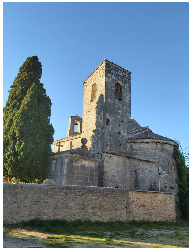
Église romane XIeme, de FERRIERE LES VERRERIES