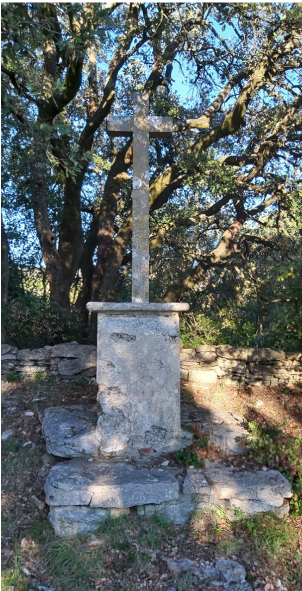
Sommet de la bute antique de FERRIERE

Nous ne savons encore pas ce que nous réserve l'année 2022 et dans plusieurs domaines. Comme celui de la santé par exemple. Voilà deux ans que la pandémie s'invite dans nos projets pour les freiner dans leur avancée. Et même pour les stopper : nos repérages ont cessé depuis le mois d'octobre. Nous devrions être arrivés à St-Guilhem mi- décembre. Pire : les virus et les incertitudes ont pour conséquence de nous figer dans un repli sur soi et la dépression s'installe. Cela n'a rien de bon. C'est pourquoi, pour 2022 il est vital que nous réagissions. Car si longue soit-elle, cette pandémie n'arrivera pas à supprimer le rêve des adhérents qui participent au projet de bretelle Uzès-St-Guilhem via Sauve . Notre entreprise a une finalité trop belle : le silence de nos vieux chemins, le rassemblement, le partage, dans une même direction... pour qu'elle ne se concrétise pas. Alors je vous invite toutes et tous à participer avec nous aux prochaines sorties qui reprendront fin janvier. Elles nous apportent tellement de bonheur. Au diable ces deux mornes dernières années de 2020 et 2021 et vive 2022 sur les chemins lumineux de saint Jacques !