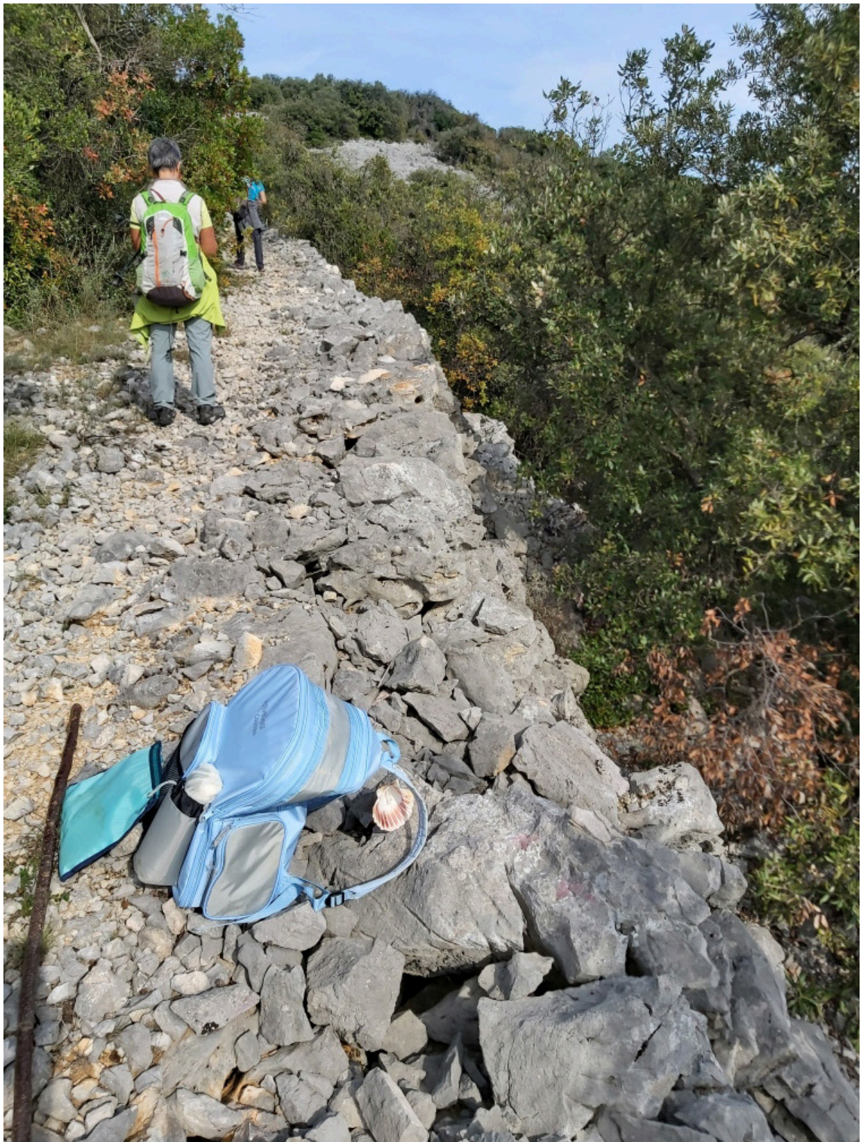
Chemin muletier et son soutènement.