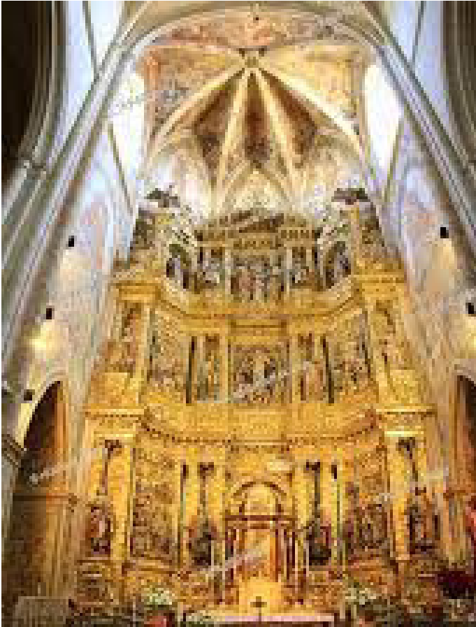
choeur baroque Viana

La petite ville de Viana entre Los Arcos et Logrono peuplée aujourd'hui de 4 000 habitants est la dernière bourgade de la grande Navarre sur le Camino avant la petite province de la Rioja. Chose curieuse, on y parle cependant le castillan, le basque n'est pas la langue officielle. A notre arrivée à la fin d'un après-midi brûlant d'août de 1994, nous nous sommes réfugiés dans la relative fraîcheur de son église Santa-Maria (XV et XVI e siècles) aux dimensions impressionnantes par rapport à la taille de la ville. Son chœur présente une haute façade baroque toute pimpante d'or qui capte le regard. De retour au soleil déclinant, nous sommes rapidement happés par l'ambiance médiévale qui émane des rues pavées, de ses portes, ultimes vestiges