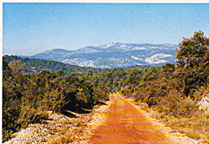
Sur le chemin.

Arrivés à St-Guilhem le Désert nous remontons le Grand chemin qui nous conduit à l'abbatiale. Le village se déroule sous nos yeux comme un panoramique au rythme de nos pas. La rigueur harmonieuse de l'abside et des absidioles, les maisons blotties autour, comme pour se protéger de quelques risques réels ou secrets, offrent aux pèlerins un merveilleux spectacle. Assis sur le banc de pierre du "gimel", avant de pénétrer dans la nef, le marcheur-pèlerin se souvient davantage de la beauté rencontrée que de la fatigue endurée.