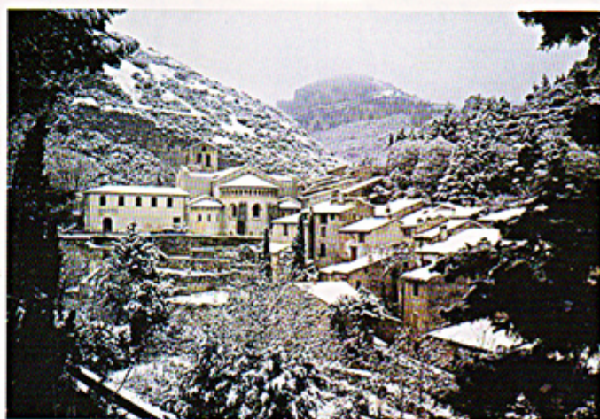
St-Guilhem en hiver.