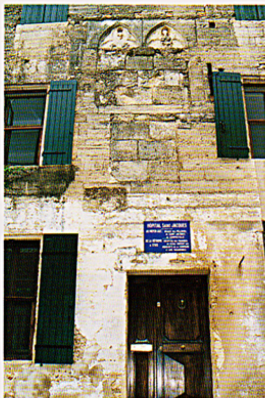
Ancien Hôpital St-Jacques. Gallargues.