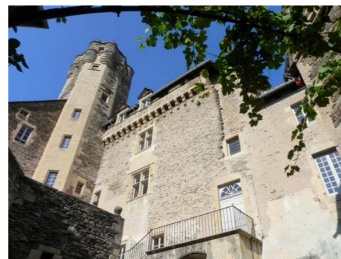
Chateau d'Estaing façade occidentale

site grandiose qui bénéficie d'une situation privilégiée au confluent de la rivière Coussane qu'on ne se lasse pas d'admirer. D'ailleurs, le petit village de moins de 500 habitants qui compte sept immeubles protégés au titre des Monuments historiques est classé parmi les plus beaux villages de France. Passé le pont sur le Lot marqué par la statue du cardinal-comte