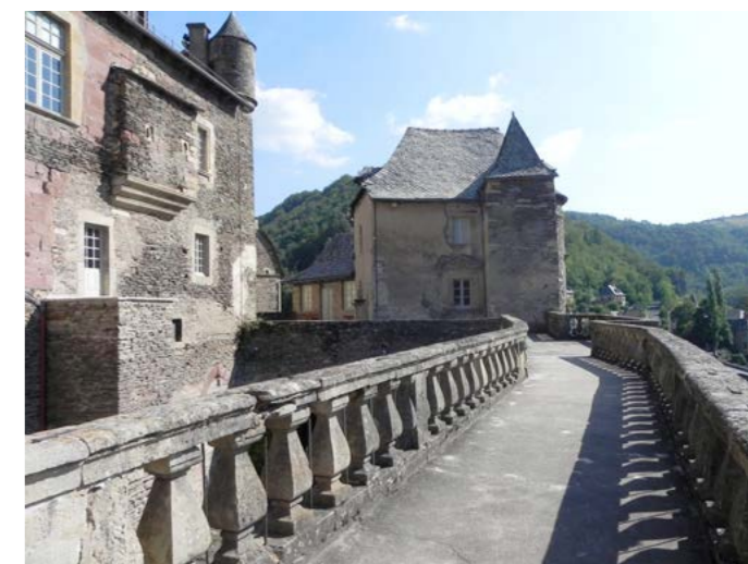
Château d'Estaing terrasse panoramique

François d'Estaing, constructeur du clocher de la cathédrale de Rodez, la découverte enthousiasmante commence dès l'entrée de la rue principale bordée de magnifiques demeures. La ruelle à droite, conduit à la place qui dessert à droite, le château du XIVE siècle, classé au MH depuis 1945. Il a été racheté à la mairie, en 2005, par l'ancien président de la République Valéry Giscard d'Estaing qui a entrepris sa rénovation. En face, l'église Saint-Fleuret contemporaine du château à laquelle on accède par une belle volée de marches et