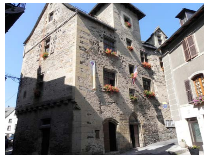
Hotel de ville et office du tourisme

site grandiose qui bénéficie d'une situation privilégiée au confluent de la rivière Coussane qu'on ne se lasse pas d'admirer. D'ailleurs, le petit village de moins de 500 habitants qui compte sept immeubles protégés au titre des Monuments historiques est classé parmi les plus beaux villages de France. Passé le pont sur le Lot marqué par la statue du cardinal-comte