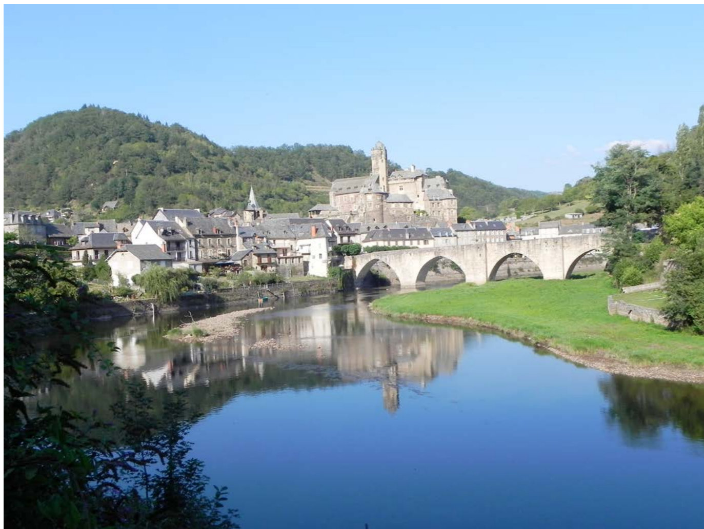
Estaing sur les rives du Lot

le soleil. Et là, subrepticement, le village d'Estaing dominé par son château surgit sur la rive opposée toute baignée de lumière. Quel spectacle ! Quelle émotion suscite cette bourgade au charme fou, avec ses maisons aux ardoises presque aussi bleues que l'eau du Lot, le pont sur la rivière et à l'arrière-plan cet écrin de verdure et de vignes pentues ! On est véritablement scotchés devant ce