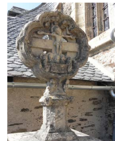
Croix du XVe siècle