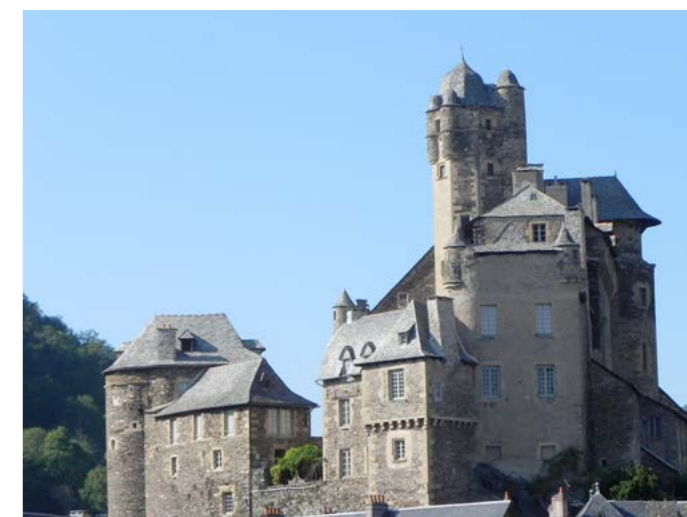
Le château domine le village

sur le parvis, une magnifique croix en pierre également du XVe siècle où l'on distingue sur une face un pèlerin implorant le Christ. Revenus dans la rue principale, la mairie est également un bâtiment remarquable du XVIe siècle, comme nombre de maisons du village et de curiosités (fontaine, oratoire, etc.) ayant conservé leur caractère et où le temps semble s'être figé au Moyen-Age.